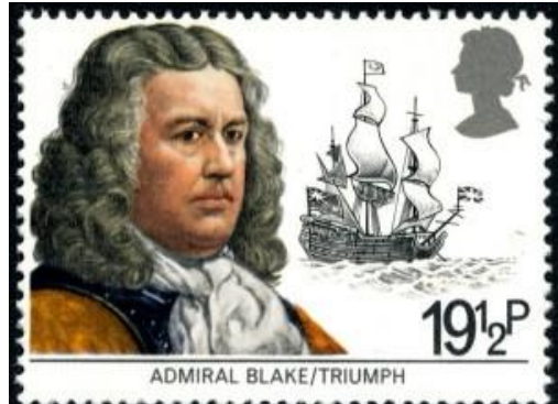
Afb. 7 Generaal ter zee (admiraal) Blake, midden 17 e eeuw grondlegger van nieuwe gevechtstechnieken voor zeegevechten

Nederland behield Suriname en ook het kleine, nootmuskaat-rijke eilandje Run in de Zuid-Molukken, die het op zijn beurt in de oorlog op Engeland had veroverd. De naam van de kolonie werd later veranderd in