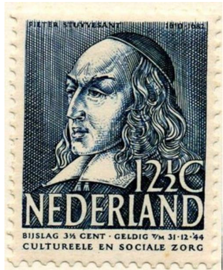
Afb. 1 Pieter Stuyvesant zomerzegel 1939 NVPH 322

dat ook de reden dat hij vervolgens de school verliet en in dienst trad van de WIC. Voor deze organisatie was hij vooral belast met bestuurlijke taken.