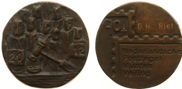
Afb. 1 2012 - Penning '70-jarig bestaan De Nederlandsche Postzegel- en Muntenveiling' door C. Ton-Rekers - VZ Veilinghamer, gestileerde personen en jaartal

Mijn adres is Rozeboom 8, 1541 RJ Koog aan de Zaan. Aanmelden via e-mail: jkluft@chello.nl . Met graag een aantal alternatieve tijdstippen. U krijgt per omgaande bevestiging. Verdere vragen op tel 075-6159227. Vanaf maandag 14 december kunt u per mail een koopnota verwachten en kunt u de gewonnen kavels bij mij afhalen.