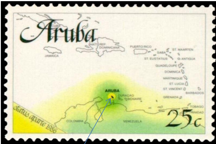
Afb. 4 Curaçao /ABC eilanden

zijn vader gestationeerd werd. Hij kreeg één of meer kamer(s) in het fort Amsterdam te Willemstad en bekleedde het ambt van hoofcommissaris van de koopmanschappen.