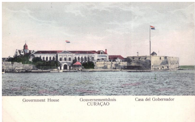
Afb. 4 Gouvernementshuis / fort Amsterdam Curaçao

Alvorens tot gouverneur van Nieuw Nederland aangesteld te worden waren er enkele tussenstappen in zijn carrière. Na het Braziliaanse Fernando de Noronha werd zijn nieuwe standplaats Curaçao , (afb.4) waar hij dankzij voorspraak van