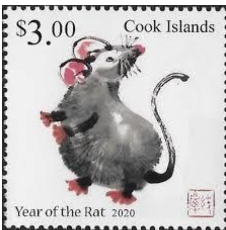
Afb. 2 Cook Islands Year of the rat