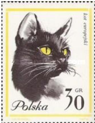
Afb. 3 Europese korthaar Polen 1965

Hij was van 1630 tot 1635 gestationeerd op de Braziliaanse eilandengroep Fernando de Noronha. Deze eilandengroep, vernoemt naar de 1 e pachter van Brazilië met dezelfde naam, die als pachter vooral bezig was met het uitvoeren van het zogenaamde Brazilhout.