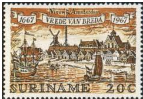
Afb. 8 Vrede van Breda Einde van de 2e Engelse oorlog